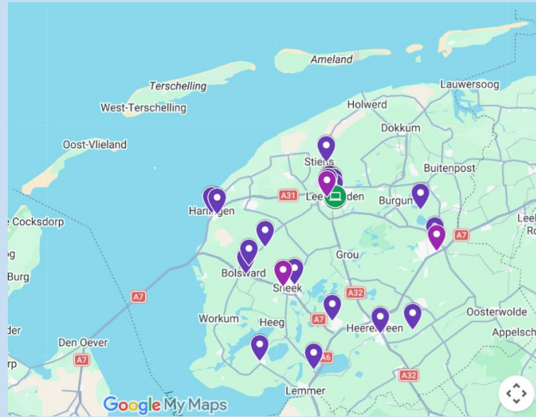
Situatie nu (excl. huisartsenpraktijken)